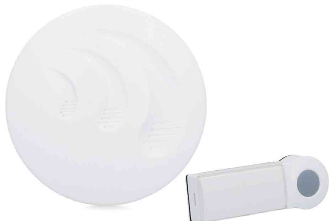
Sonnette sans fil "BASIC"