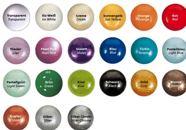
Sélection de couleurs