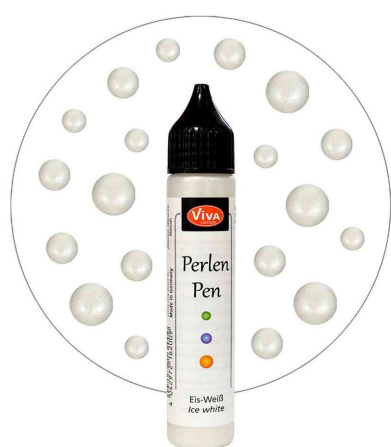
Visuel de référence : Stylo à perles