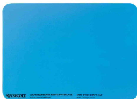
Sous-main de bricolage en silicone