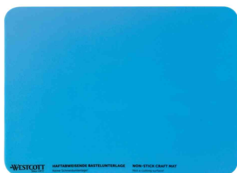
Sous-main de bricolage en silicone