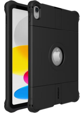
Black 77-89980 (ProPack) 840262399937