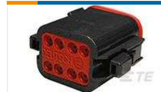
TE Teilnr.:DT06-08SB-CE06 PLG, 8P, BLK, E, SEAL RET, B