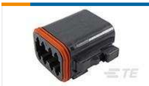
TE Teilnr.:DT06-08SB-C015 PLG, 8P, BLK, E, B