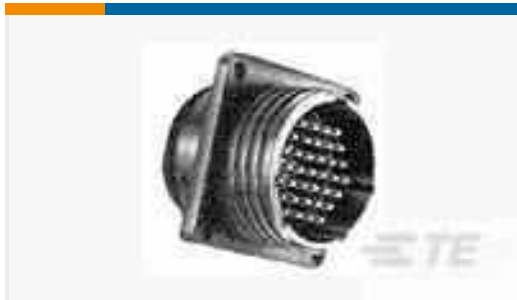
TE Teilnr.:183075-1 SQUARE FLG.23-24STD.SEX SRS 1