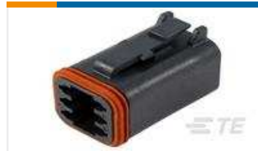
TE Teilnr.:DT06-6S-CE02 PLG, 6P, BLK, E