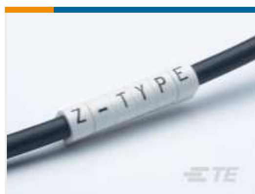
TE Teilnr.: CAT-T3437-Z1 Z-TYPE-AUFSCIEBMARKIERER