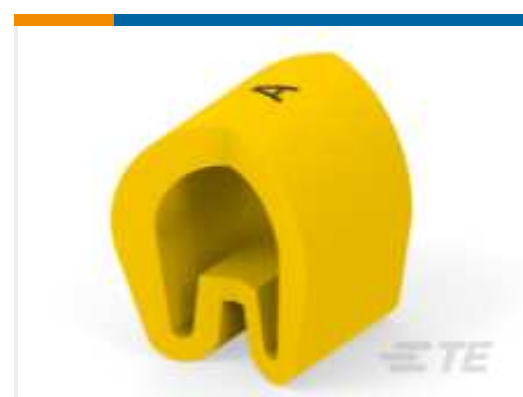
TE Teilnr.: EC1637-000 06243410