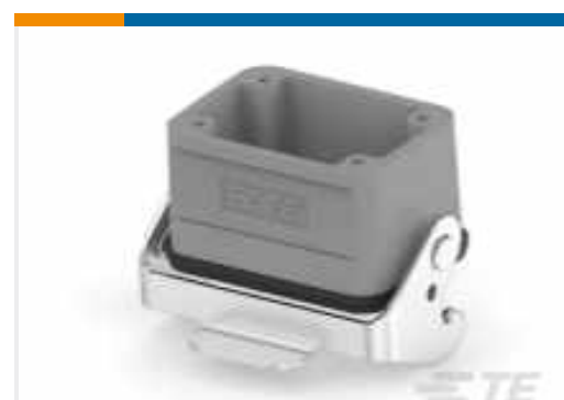
TE Teilnr.:T1730060000-000 H6B-TBF-T