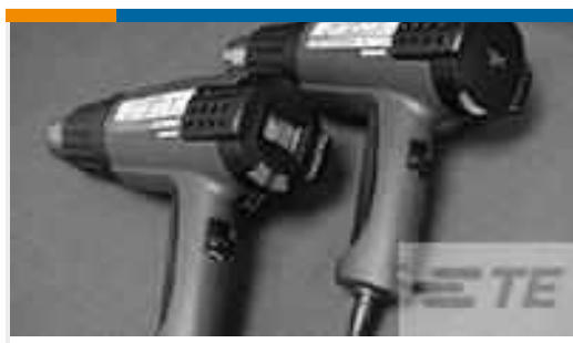
TE Teilenummer CJ2087-000 HL2010E-KIT-120V