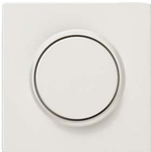
DELTA STYLE, TITANWEISS ABDECKPLATTE FUER DIMMER MIT DREHKNOPF 68X68MM