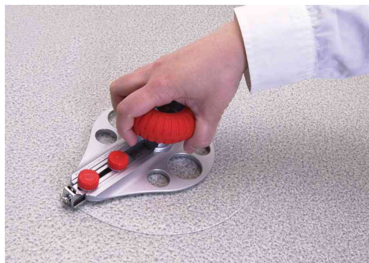
Visuel de référence : montre le produit en utilisation