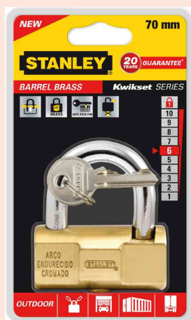
Visuel de référence: Cadenas KWIKSET SERIE, sous blister