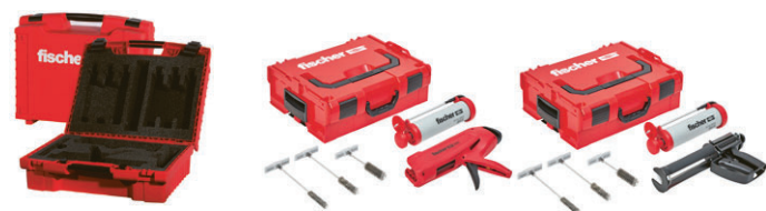
Thermosafe Koffer FIS V, leer