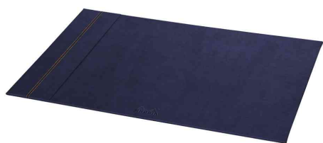
Sous-main, bleu nuit