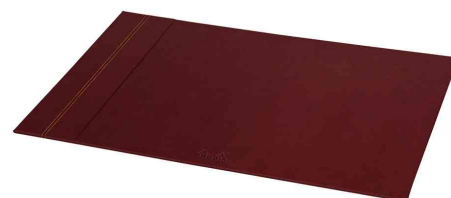
Sous-main, lie de vin