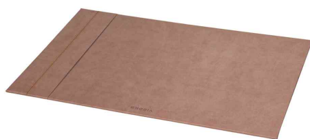
Sous-main, bois de rose