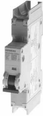
Leitungsschutzschalter 240V 14kA, 1-polig, D, 5A, T=70mm nach UL 489