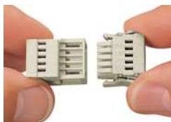
Verriegelungsklinken zum Schutz gegen unbeabsichtigtes Trennen