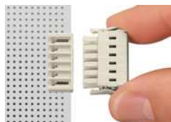
Verriegelungsklinken zum Schutz gegen unbeabsichtigtes Trennen