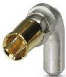
POWER-Kontakt, für D-SUB-Kombinationseinsätze, für Leiterplattenmontage, Buchse, abgewinkelt, Bemessungsstrom 40 A, vergoldet

Bitte beachten Sie, dass die hier angegebenen Daten dem Online-Katalog entnommen sind. Die vollständigen Informationen und Daten entnehmen Sie bitte der Anwenderdokumentation. Es gelten die Allgemeinen Nutzungsbedingungen für Internet-Downloads. ( http://phoenixcontact.de/download )