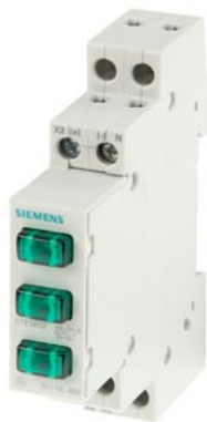
Leucht- / Phasenmelder 3x LED, 12..60V grün