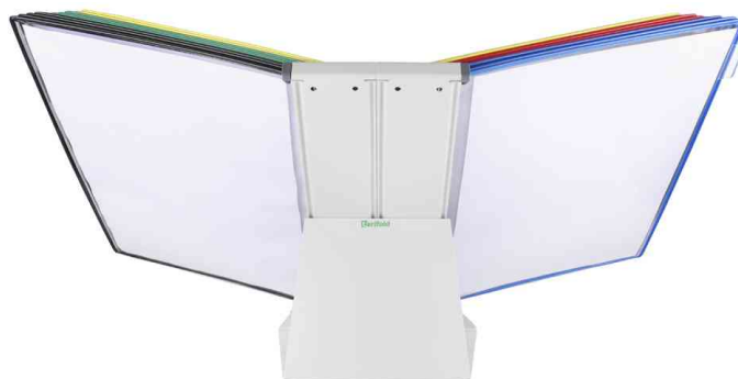
Kit pupitre métal, vue de dos