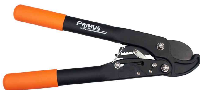
Coupe-branches pour dames Dual-Cut