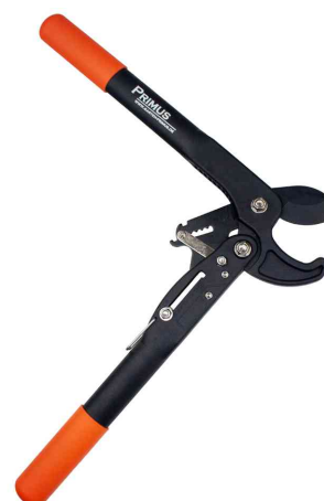
Coupe-branches pour dames Dual-Cut