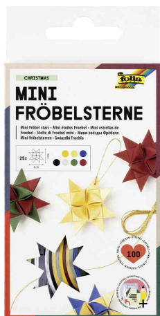
Bandes de papier pour réaliser des mini-étoiles de Froebel (couleurs de Noël)