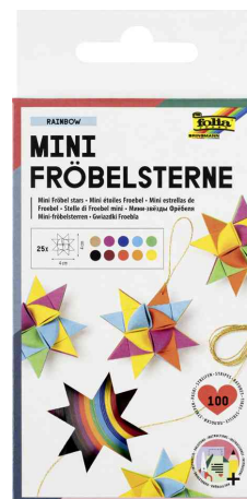
Bandes de papier pour réaliser des mini-étoiles de Froebel (couleurs pour toute l'année)