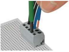
Leiter anschließen – Serie 739.