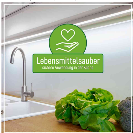
adapté au contact alimentaire - utilisation sûre en cuisine