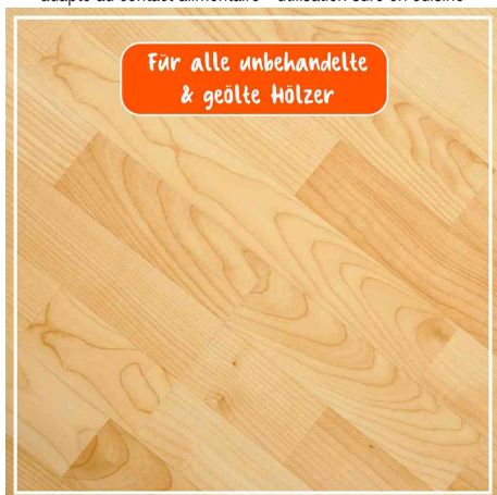
pour tous les bois non traités et huilés