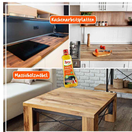
pour les plans de travail de cuisine et les meubles en bois massif