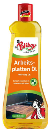
Huile pour plans de travail "Arbeitsplatten Öl" 500 ml