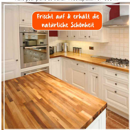
rafraîchit & préserve la beauté naturelle