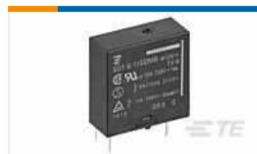
TE Teilnr.:8-1419125-5 SDT-S-106LMR,000