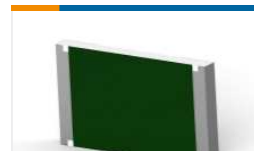
TE Teilnr.:8-2176407-8 3560 27R 5%