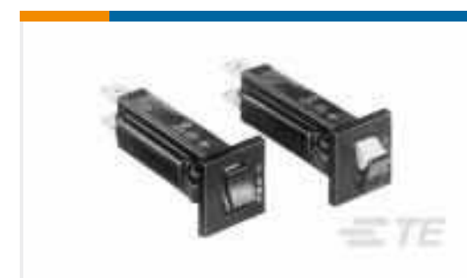
TE Teilnr.:1-1393250-7 W28-XQAT-15=W28