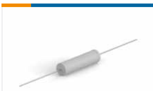
TE Teilnr.:4-2176414-8 7W STD M/OX 5% 1K8