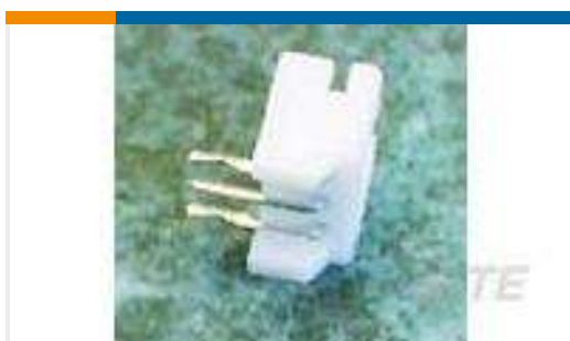
TE Teilnr.:1-440055-1 2.0MM,HDR,11POS,R/A