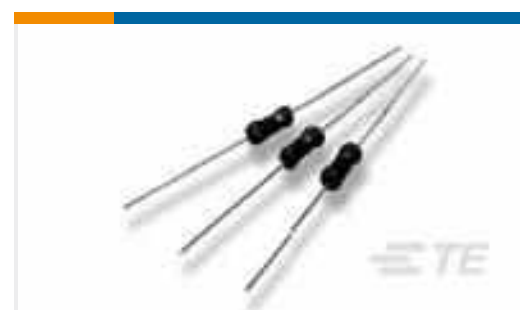
TE Teilnr.:4-1879350-2 RR01 5% 11R AMMO