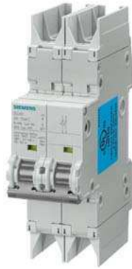
Leitungsschutzschalter 10kA, 2-polig, D, 30A nach UL 489-480Y/277V