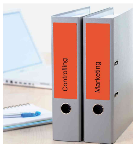
Orderrücken-Etiketten SPECIAL, Anwendung