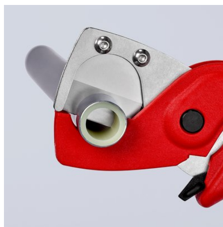
La cuchilla afilada de alta resistencia corta suavemente tuberías de material combinado y plástico sin dejar rebajas