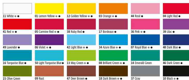
Peinture pour textiles JAVANA, couleurs