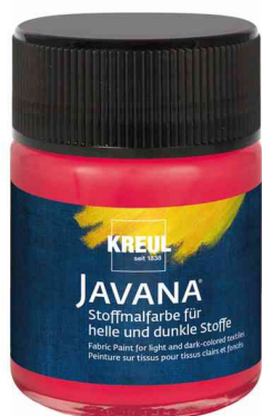
Peinture pour textiles JAVANA, 50 ml