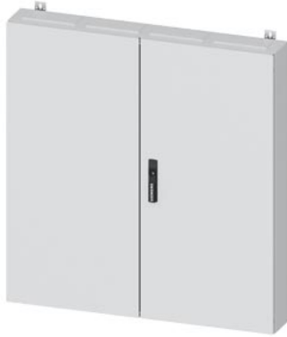
ALPHA 160 DIN Wandverteiler Aufputz mit Verteilerfeld, IP44, Schutzklasse 2 H=1100mm, B=1050mm, T=140mm RAL 9016