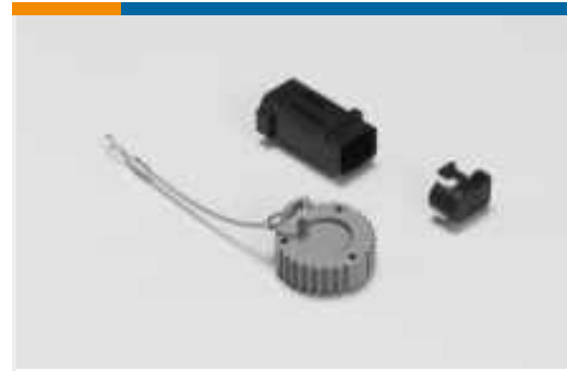
Kappen und Abdeckungen für Kraftfahrzeuge(11)