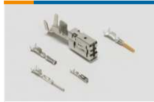
Kontakte für Kraftfahrzeuge(130)