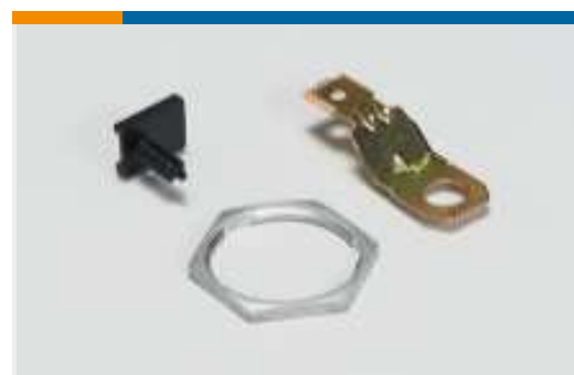
Weiteres Zubehör für Automobilsteckverbinder(1)