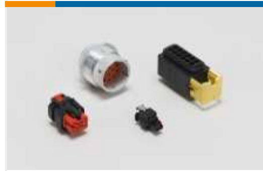
Gehäuse für Kraftfahrzeuge(220)