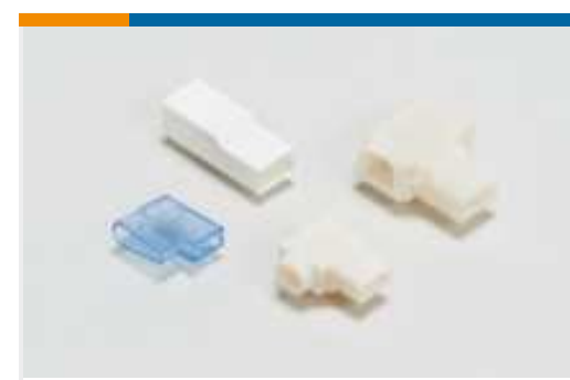
Gehäuse für Crimpkontakte(13)