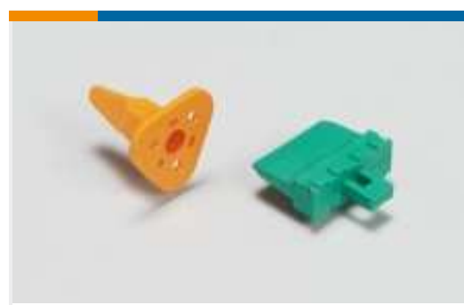
Arretierungen und Positionssicherungen für Automobilsteckverbinder(16)