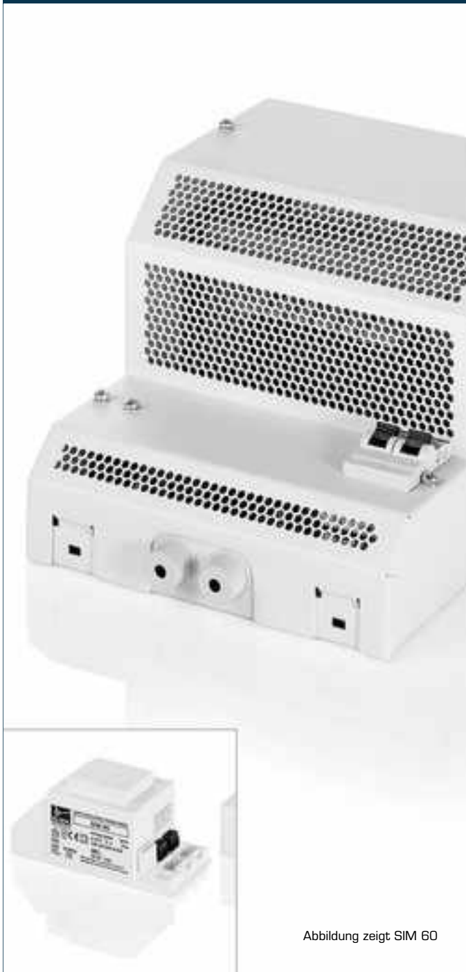
Abbildung zeigt SIM 60