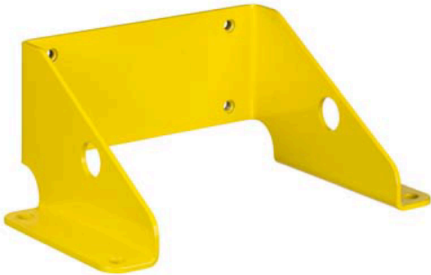
Art.-Nr.: 53800132 BTF815M Montagewinkel