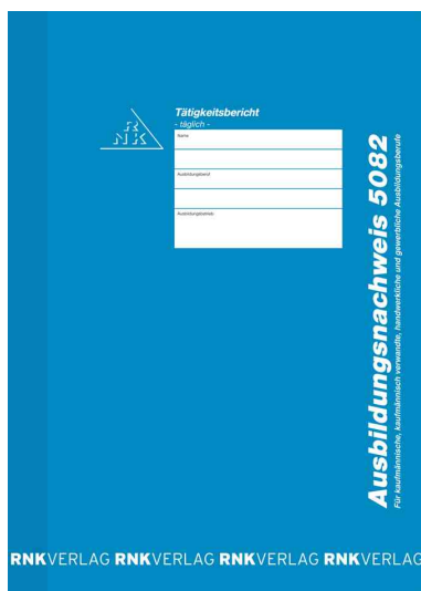
Ausbildungsnachweis-Block 5082, täglich