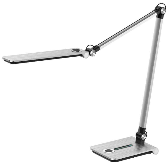
Lampe de bureau à LED Wave, argent brossé