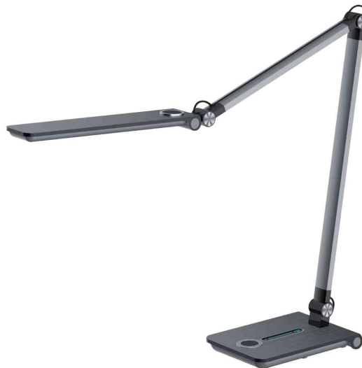
Lampe de bureau à LED Wave, gris métallique