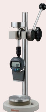
Testing stand - Workstage dimension: Ø90 mm - Max. specimen height: 90mm