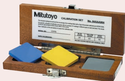
64AAA964 Shore A