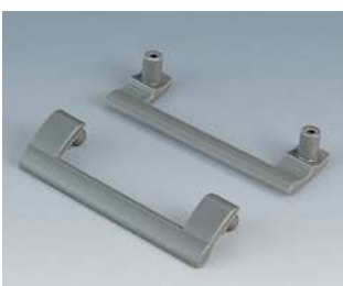
B7110028 Befestigungselemente L / M / S PA 6 vulkan