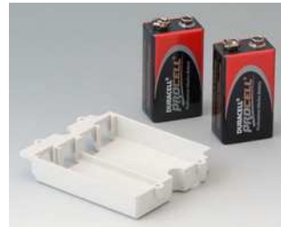
A9174002 Batteriefach, 2 x 9 V ABS (UL 94 HB) grauweiß RAL 9002