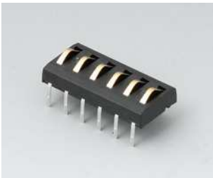
A9178007 Kontakte, männlich vergoldet