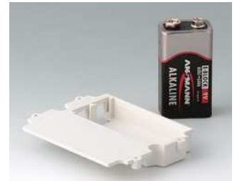
A9174003 Batteriefach, 1 x 9 V ABS (UL 94 HB) grauweiß RAL 9002