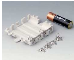
A9345217 Batteriefach-Set, 4 x AA ABS (UL 94 HB) grauweiß RAL 9002