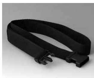
B7110139 Gurtband schwarz 1200x30mm