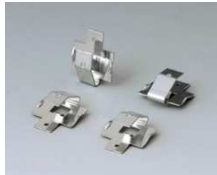
A9161002 Kontaktfedern-Set, 2 x 9 V oder 4 x AA Stahl verzinkt