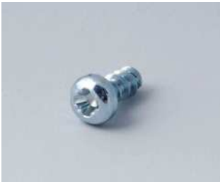
A0305031 Selbstformende Schraube 2,5 x 6 mm (PZ1)