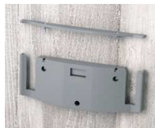
B7120048 Wandhalter-Set L PA 6 vulkan