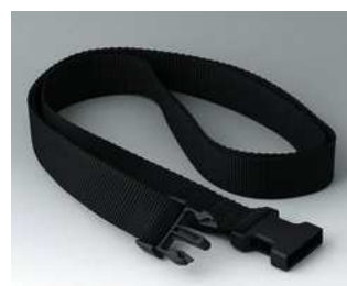
B7110149 Gurtband schwarz 1500x30mm