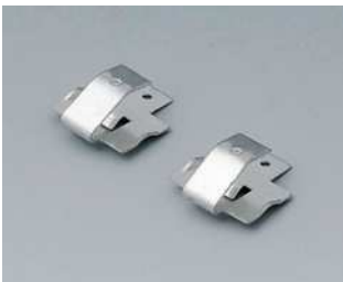
A9174006 Kontaktfedern-Set, 1 x 9 V Stahl verzinkt