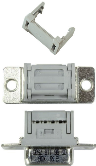
bisherige Version · OLD VERSION ancienne version