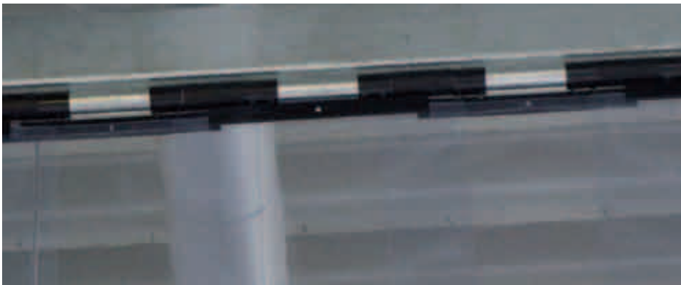
Verzinkte Rohrwellen mit stabilen Blechaufhängungen