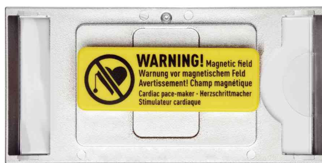
Pièce de dos à aimant