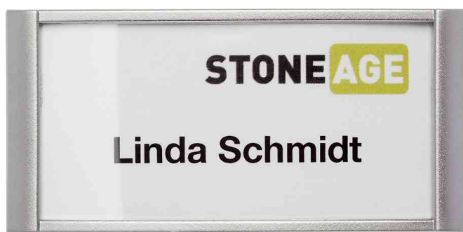
Visuel de référence: badge CLASSIC