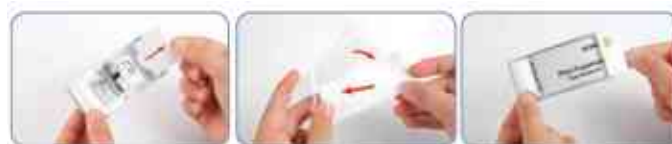
Echange facile des étiquettes