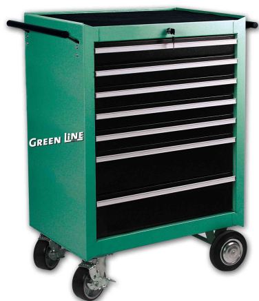
Servante d'atelier, équipé, 321 pièces