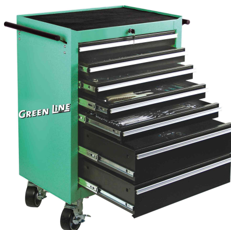
Servante d'atelier, équipé, 321 pièces