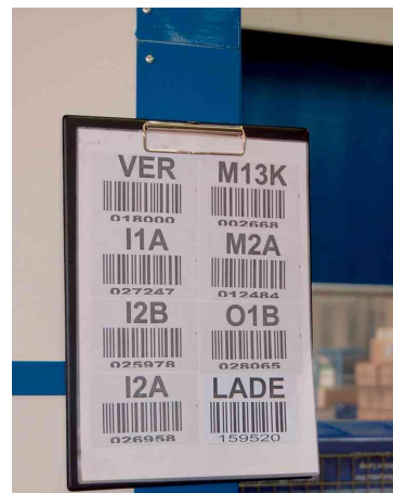
Klemmbrett mit Folienüberzug und 2 Neodym-Magnete, Anwendungsbeispiele