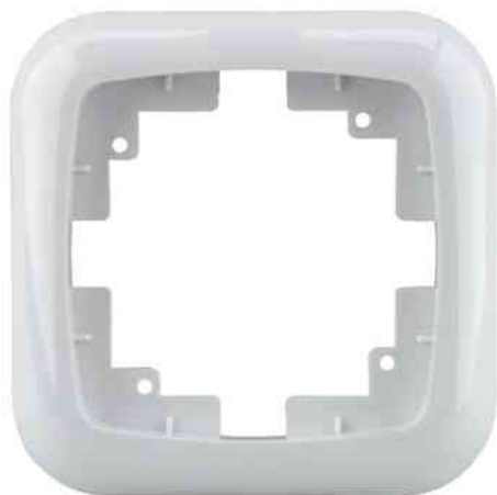
Abdeckrahmen für "ROMA" Steckdose und Schalter, 1-fach