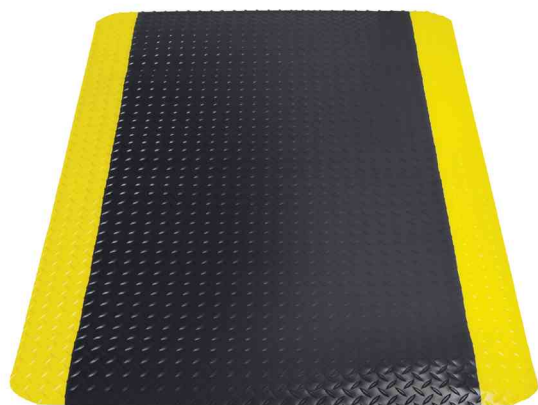
Arbeitsplatzmatte Yoga Deck Ultra