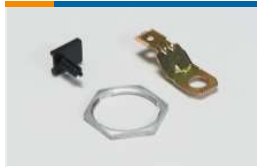
Weiteres Zubehör für Automobilsteckverbinder(1)