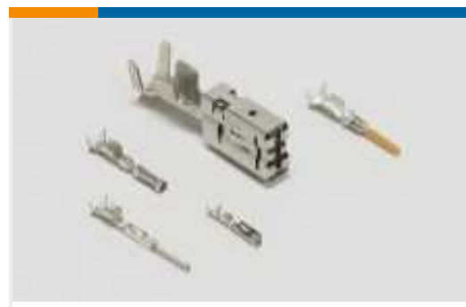
Kontakte für Kraftfahrzeuge(81)