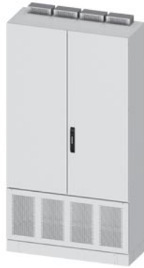
ALPHA DIN Trafo-SCHRANK H=1950mm B=1050mm T=400mm incl. 100mm Sockel Stahlblechtuer geschlossen Seitenwand SK1, IP30