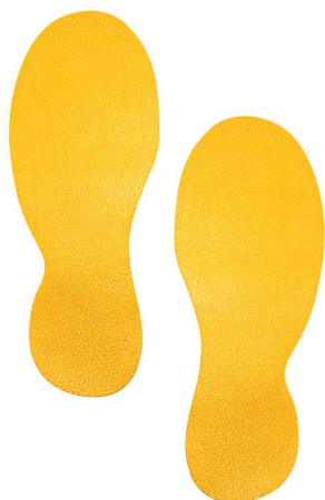
Symbole de marquage au sol "Pieds"