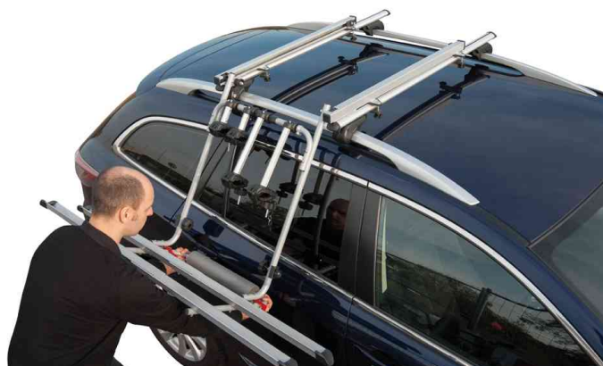
Dachlift-Fahrradträger, einfaches Aufladen