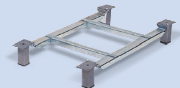
Untergestell mit 4 Sockelfüßen, für Typ SB 400 und SB 550