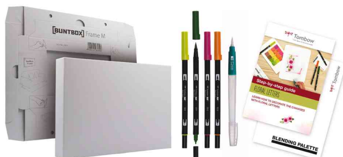
Kit aquarelle & toile "Lettres florales"