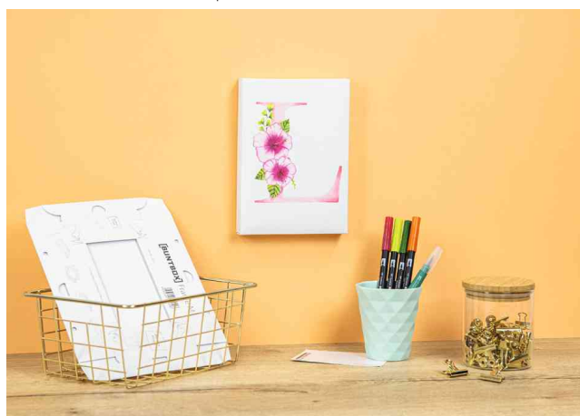
Visuel de référence : le résultat final pourrait ressembler à ceci