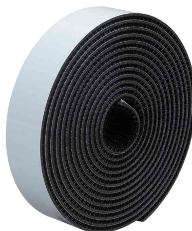
Système ouvrable/refermable flexible Dual Lock SJ3540, rouleau